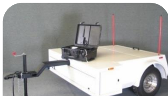
▲ CS9200 Sistema Remolque ▲

Perfilómetros Livianos y Multipropósitos: El Sistema Liviano CS8700 y el CS9200 Multipropósito pueden perfilar concreto sin curar o asfalto caliente más rápidamente que los sistemas de perfil montados en vehículos normales. El CS9200 trabaja como un sistema liviano o de alta velocidad. Como los otros sistemas de perfil de SSI, el CS8700 y el CS9200 son equipos de Clase I ASTM E950 garantizados para complacer a especificaciones de agencia. Para pruebas sobre pavimentos con textura gruesa o concreto con estrías, un láser Gocator de amplia huella se usan para índices menores y menos áreas de rugosidad localizada. El CS8700 y el CS9200 tienen las mismas capacidades que los sistemas de alta velocidad de SSI. Los sistemas de SSI han sido diseñados con soporte en mente—todos los componentes principales son portátiles, remplazables en el campo y disponibles para envíos exprés.