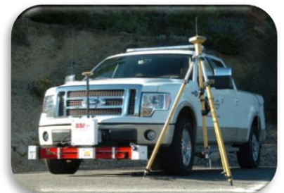
▲ CS9300 GeoProfiler ▲