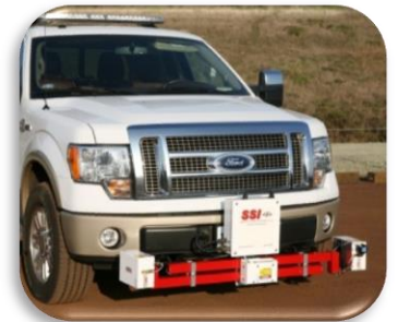
▲ CS9300 Sistema Portátil ▲