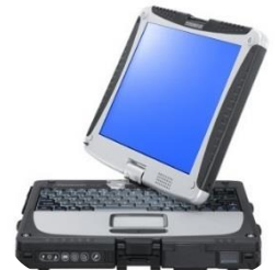
▲ Panasonic CF-19 ▲