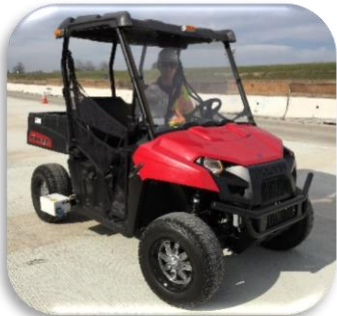
▲ CS8700 Perfilómetro Liviano