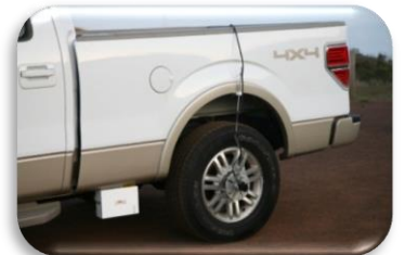
▲ CS9100 Montaje Central