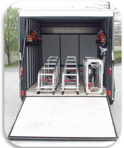
▲ Remolque Cerrado Opcional ▲